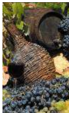
Varietà di formaggi, salumi, vini tipici sardi