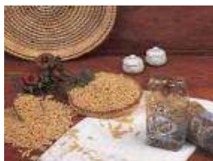
"Malloreddus" e "Culurgionis" pasta tipica sarda

Altro noto digestivo é il " Filu e Ferru " che prende il nome dalla pratica di nascondarlo sotto terra legato a un filo di ferro appunto poichè la sua produzione era vietata. É una grappa di vinacce .